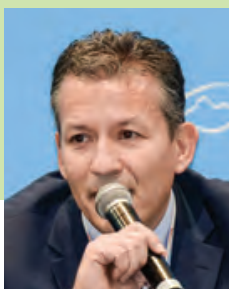
斯塔夫羅·伊凡格拉卡基斯 盧森堡貨運航空