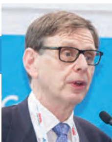
馬丁·史托福 克拉克森研究