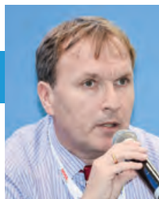
羅伯特·凡德域 空橋貨運航空