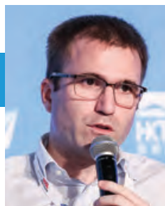
皮爾·瓦朗 Lazada 集團