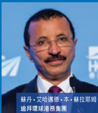
蘇丹·艾哈邁德·本·蘇拉耶姆 迪拜環球港務集團