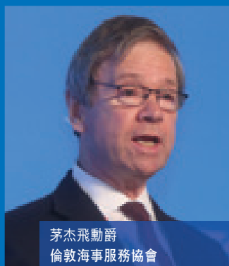
茅杰飛勳爵 倫敦海事服務協會