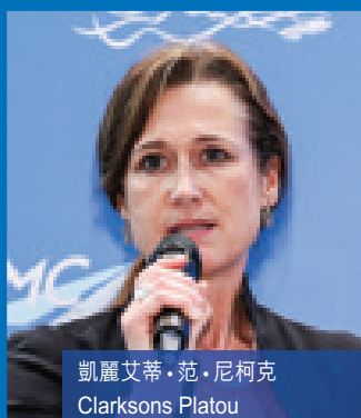
凱麗艾蒂·范·尼柯克 Clarksons Platou