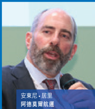
安東尼·居里 阿德莫爾航運