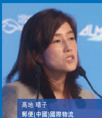
高地 晴子 郵便(中國)國際物流